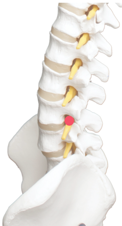
Spinaal ganglion op lumbaal niveau

Bij bepaalde aandoeningen vermindert de pijn slechts tijdelijk na één of meerdere inspuitingen rond de zenuwwortels. In dat geval kan de arts beslissen om de zenuwtakjes te behandelen met een elektrische lading, zodat de pijngeleiding door deze zenuwen langer onderdrukt wordt. Deze procedure noemt men een 'radiofrequente denervatie' omdat er hoogfrequente golven gebruikt worden om deze stroom te creëren. Gepulseerd wil zeggen dat de stroom in kleine pakketjes gegeven wordt.